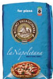
TIPO 00 laNapoletana

Five perfect flours for the modern-day professional and laNapoletana, the flour for the authentic Neapolitan pizza chef. Approved by AVPN, the protection consortium for Pizza Napoletana, our flour is perfect for bringing out its finest characteristics: the speckled outer crust, soft texture and flavour of the finest ingredients in the world.