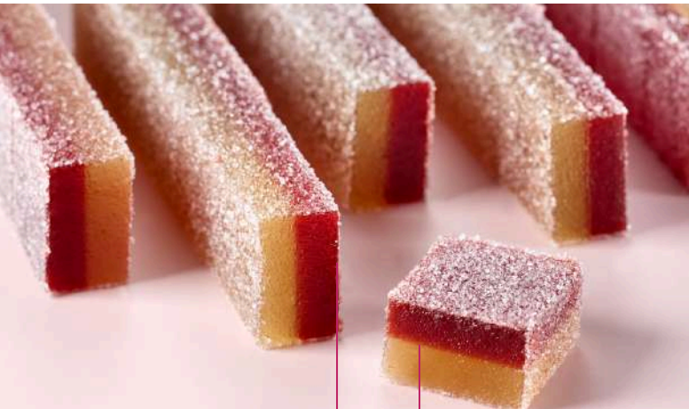
ρâte δαμάσκηνο και βανίλια

Φέρτε τον πουρέ αχλαδιού με την τριμμένη τόνγκα σε βρασμό σε μια μεγάλη κατσαρόλα, ανακατεύοντας συνεχώς. Εν τω μεταξύ, αναμείξτε τη ζάχαρη (1) με την πηκτίνη. Προσθέστε το μείγμα της πηκτίνης στο ζεστό πουρέ και αφήστε το να βράσει ξανά για 2 έως 3 λεπτά. Προσθέστε τη ζάχαρη (2) σε 3 ή 4 διαδοχικά στάδια, ανακατεύοντας καλά μετά από κάθε προσθήκη, και στη συνέχεια προσθέστε τη γλυκόζη. Μαγειρέψτε την πάστα φρούτων αχλαδιού-τόνγκα μέχρι να φτάσει 75°Brix. Αποσύρετε από τη φωτιά και προσθέστε το διάλυμα κιτρικού οξέος. Χωρίστε το μείγμα σε δύο μέρη. Ρίξτε κάθε μείγμα πάνω από την παγωμένη πάστα φρούτων δαμάσκηνο. Αφήστε να σταθεροποιηθεί.